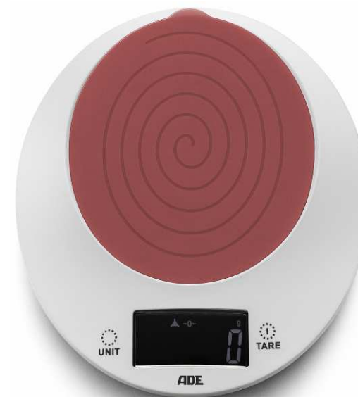
Tavola dei contenuti